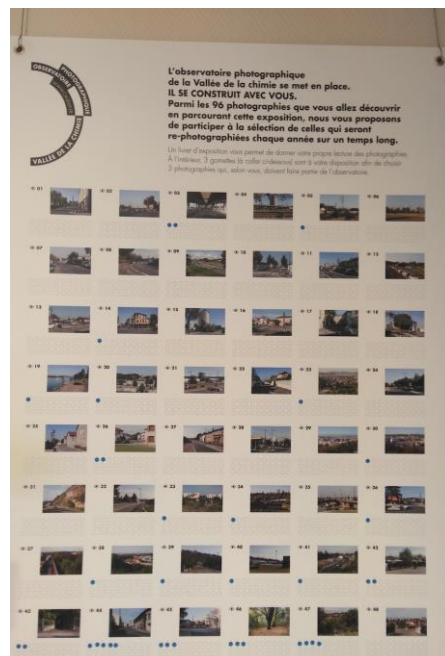
Figure 4 - Panneau itinérant de l'exposition OPP Vallée de la Chimie, Feyzin, février 2019

La seconde situation fait intervenir l'écriture d'un discours sur l'image, par des voies plurielles, avec une consigne unique : « participer à la sélection [des photographies] qui seront rephotographiées ». La planche d'images suivante (Figure 4) constitue un sommaire global du fonds photographique qui est aussi disposé dans l'espace de la salle, c'est également le lieu de la synthèse puisque l'avis individuel (le vote par une gommette) y est consigné. De même, les livrets sont recueillis dans une boîte située sous les panneaux (Figure 5).