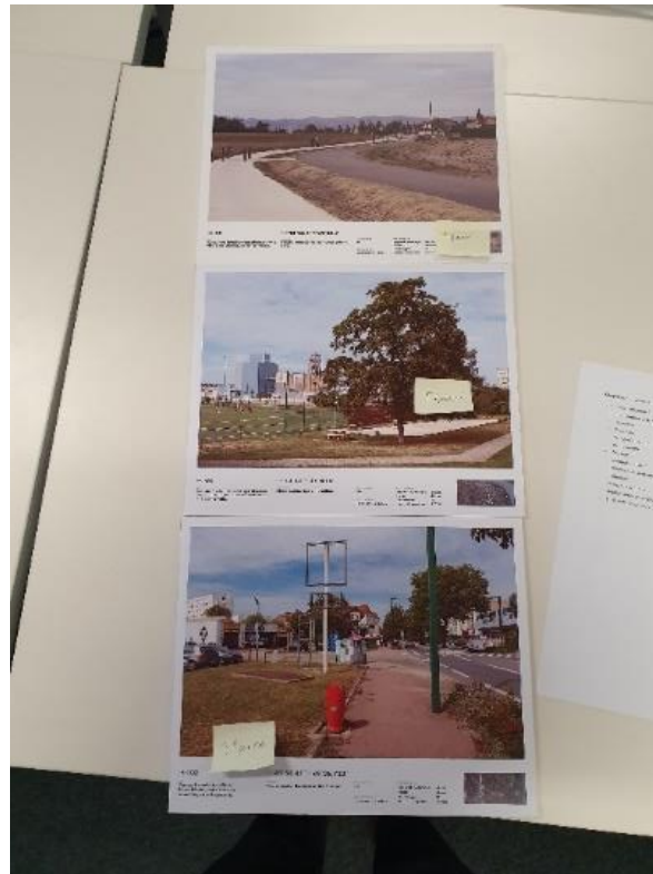
Figure 6 – Jeu d’images sélectionnées à commenter par écrit - Comité d’experts, décembre 2019

Dans l’exemple ci-dessous tiré de l’étude sur la tempête de 1999 (Figure 7), un « Point de vue » est singularisé : il va désigner alors une zone (« vue dans le sens opposé »). Ces photographies ainsi ajoutées à l’observatoire (son itinéraire) recomposent de nouvelles séries et génèrent une variation formulaire autour du « Point de vue » : « Point de vue 20 de l’Observatoire », « Point de vue décalé », « Point de vue d’un autre secteur ». Ce sont, par exemple, les « images manquantes » que l’animateur de l’observatoire va réaliser en complément de la série prévue par l’observatoire, ou encore, dans notre exemple, les images produites par l’Agence Paysages elle-même. Cette pratique de la « note de bas de page » photographique atteste de la manière dont le dispositif de veille est investi, interprété, manipulé, approprié (La tempête de 1999..., p. 100) mais aussi reconnu et légitimé.