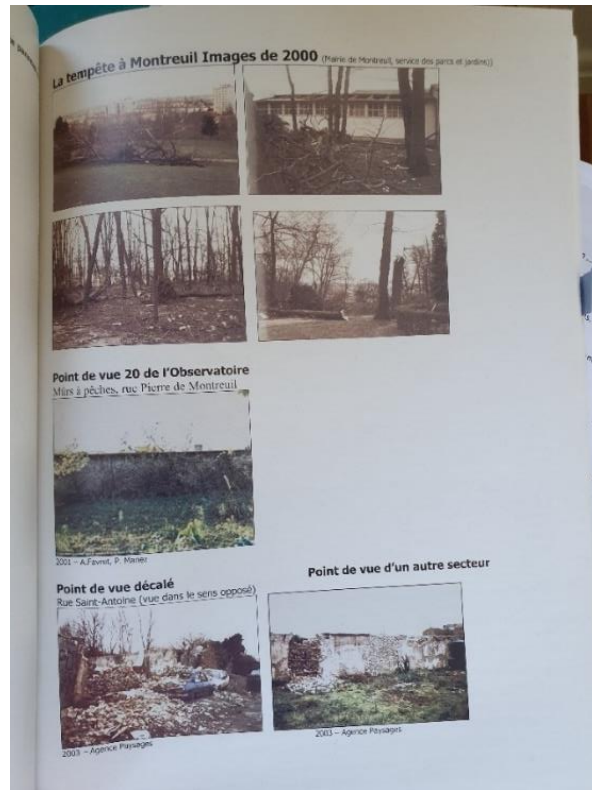
Figure 7 - La tempête de 1999 dans l'œil de l'OPP, p. 55

L'éditorialisation des différentes photographies singularisées forme à la fois un compte-rendu de l'enquête (les traces de la tempête dans un territoire localisé à partir de l'observatoire) et un instrument au service de cette enquête (comparer, confronter, documenter le lieu du crime). Parce que la tempête est « aléatoire dans l'espace » (p.31), la variation diachronique (l'écart entre deux états que la vigilance observe dans le temps) est saisie à partir d'une variation spatiale effectuée à partir du point de vue initial de l'observatoire (ici, le n°20). Il est particulièrement intéressant d'observer le jeu d'échelles qui est ici rendu saillant : la problématique nationale de la catastrophe naturelle est relocalisée dans une zone délimitée par les images photographiques assemblées sur cette page, un milieu. Ainsi, la valeur sociale de l'image comme efficace à veiller sur nos milieux repose moins sur la représentation d'un espace géographique unifié et commun, que sur la poétique du fragment (le milieu est représenté par autant de « vues » qui sont dissociées les unes des autres). Ce sont les discours produits à partir des « vues » qui les relient entre elles.