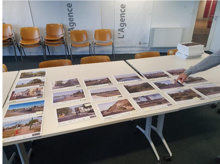
Figure 3 - Comité d'experts, décembre 2019

La seconde situation fait intervenir l'écriture d'un discours sur l'image, par des voies plurielles, avec une consigne unique : « participer à la sélection [des photographies] qui seront rephotographiées ». La planche d'images suivante (Figure 4) constitue un sommaire global du fonds photographique qui est aussi disposé dans l'espace de la salle, c'est également le lieu de la synthèse puisque l'avis individuel (le vote par une gommette) y est consigné. De même, les livrets sont recueillis dans une boîte située sous les panneaux (Figure 5).