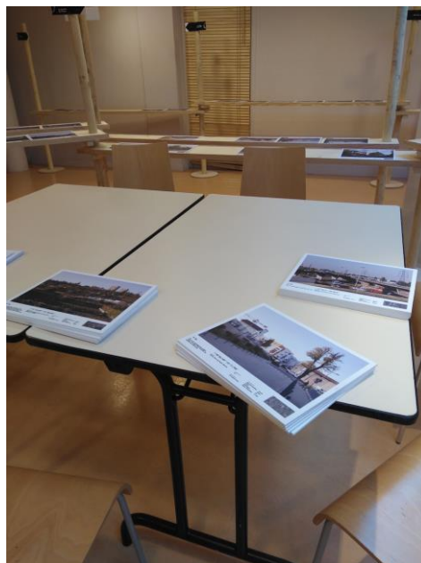
Figure 2 - Exposition, Médiathèque de Feyzin, février 2019